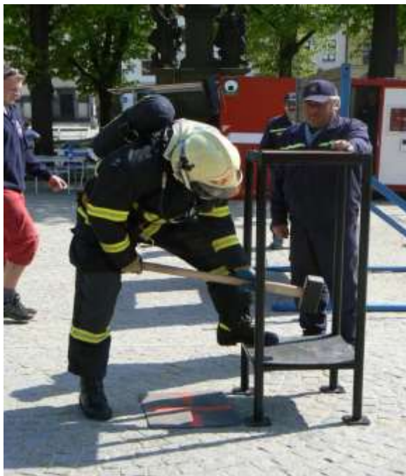
Práce s kladivem HAMMER box

Práce s kladivem - Hammer box – soutěžící uchopí palici a v tzv. hammer boxu provede celkem 60 úderů do spodní a horní hranice. Po ukončení soutěžící odloží palici mimo Hammer box.