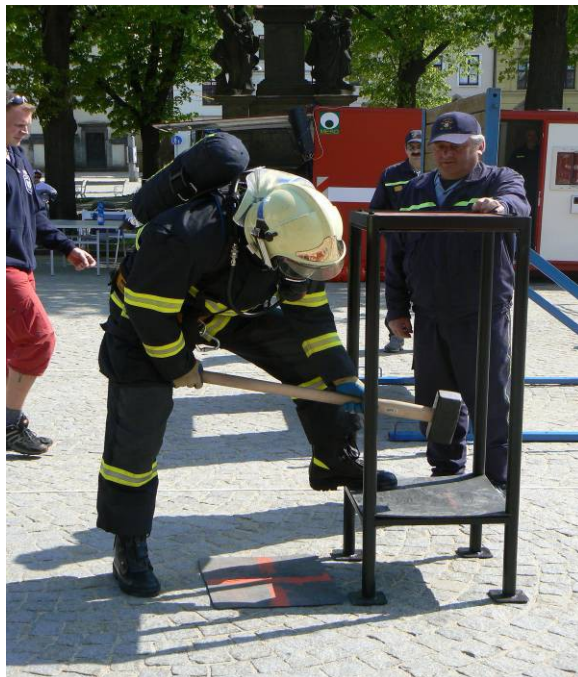
Práce s kladivem HAMMER box

Práce s kladivem - Hammer box – soutěžící uchopí palici a v tzv. hammer boxu provede celkem 60 úderů do spodní a horní hranice. Po ukončení soutěžící odloží palici mimo Hammer box.