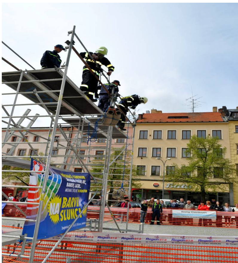
Překonání překážky – na úseku překonává závodník bariéru, výška 2 m